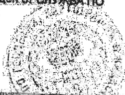
Схема № 15-1364236-23.11.2022 г. издадена въз основа на заявление с входящ № 01-666759-15.11.2022 г.